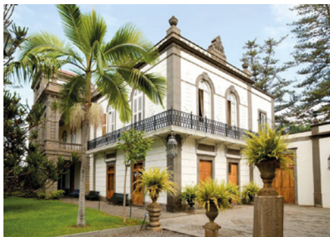
Jardín de la Marquesa

La organización pondrá a su disposición servicio de traslado en autobús: INFORMACIÓN en la web y la APP.